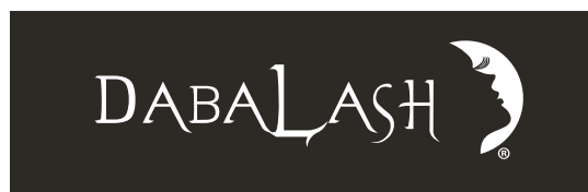
Fondo oscuro o fotografía