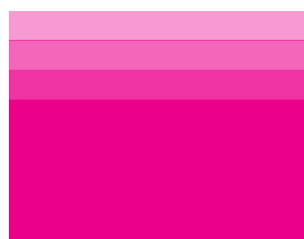
Process Magenta C